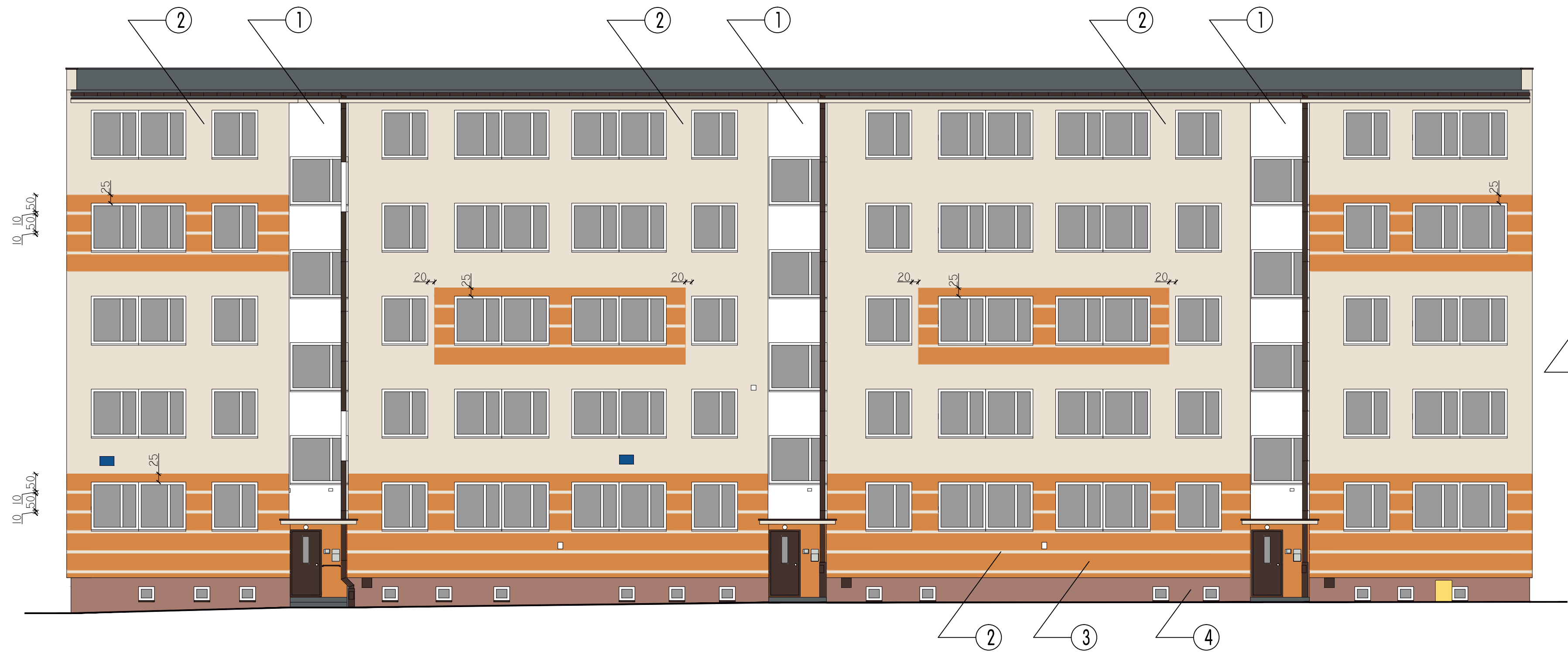
ELEWACJA WSCHODNIA skala 1:100

UWAGA: 1. Kolory na wydruku przybliżone do projektowanych. Rzeczywiste kolory (próbki) wg wzornika dla wybranego producenta Wykonawca zobowiązany jest przedstawić do akceptacji inwestorowi przed zamówieniem całości materiałów kolorowych.